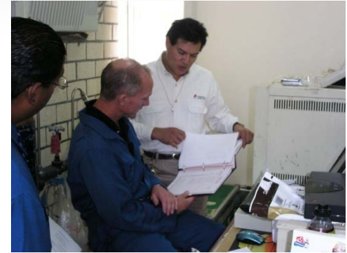
Consultarías y servicios guiados en aplicaciones Analíticas y de Laboratorio de gases