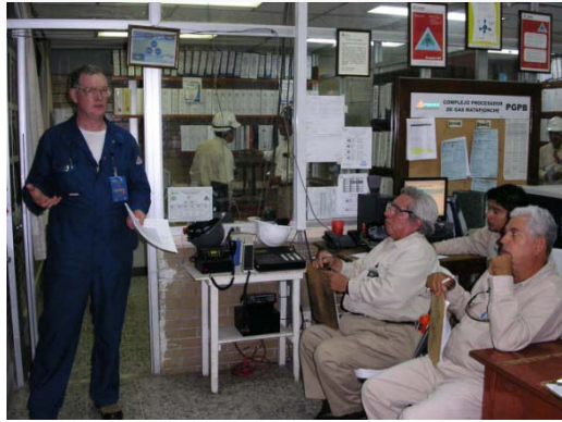
Certificación a operadores en plantas de Azufre