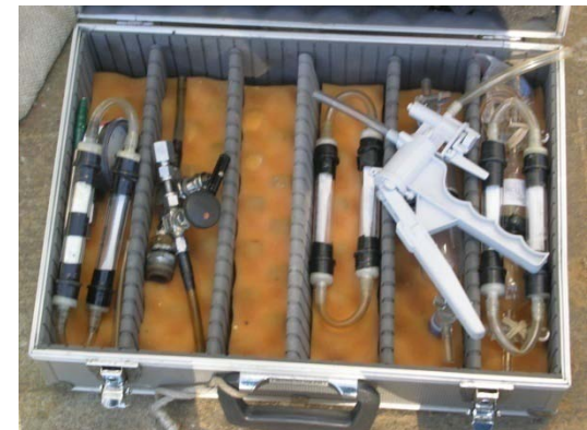
Equipos analíticos portátiles En el país