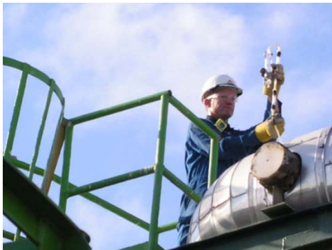
Pruebas de cumplimiento y de Certificaciones de Proceso